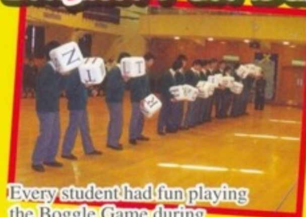
Every student had fun playing the Boggle Game during the English Fun Day.