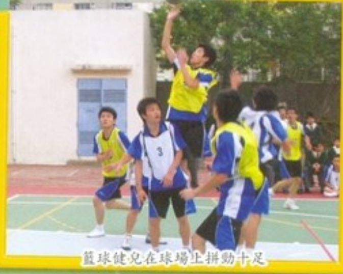
籃球健兒在球場上拼勁十足