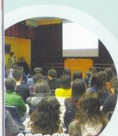
我校同工積極參與新學制的工作坊