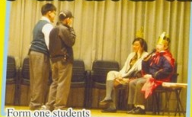
Form one students participated actively in the mini-drama.