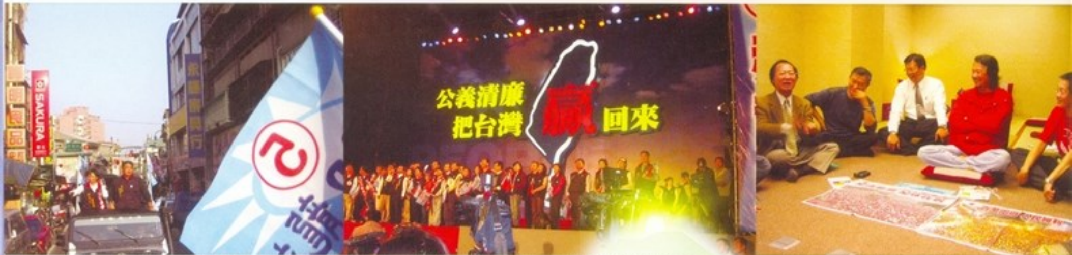
站在台北市市長候選人郝龍斌的競選車上