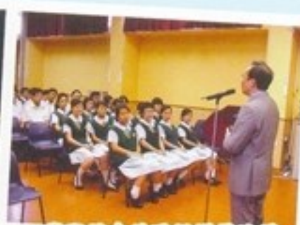
同學聚精會神聽梁議員演講