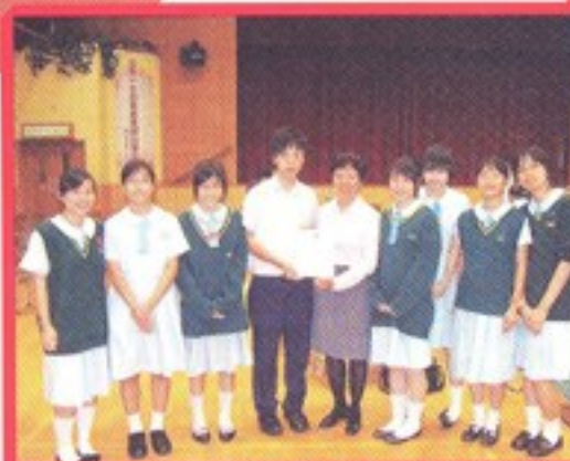
學生會全體幹事與紅十字會負責人何太合照