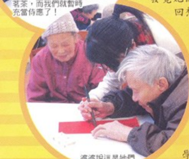
婆婆說這是她們第一次寫大字啊！！