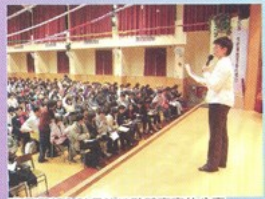
家長們都全神貫注地聆聽嘉賓的分享