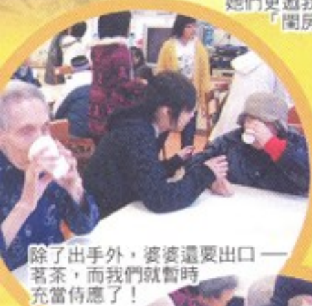
除了出手外，婆婆還要出口一茗茶，而我們就暫時充當侍應了！

活動當天，真的發生了意外。在進行「蒙眼寫大字」的遊戲時，很多婆婆都說自己「唔識字」，結果要臨時改變遊戲規則，由各義工協助她們寫大字，而且是不需蒙眼的。這次經歷讓我學懂如何臨時應變。除此以外，我還學了很多東西，又可以帶給婆婆們歡樂，真希望日後還有機會參與義工服務！