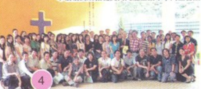
本校校長及教職員與九龍工業中學同工合照