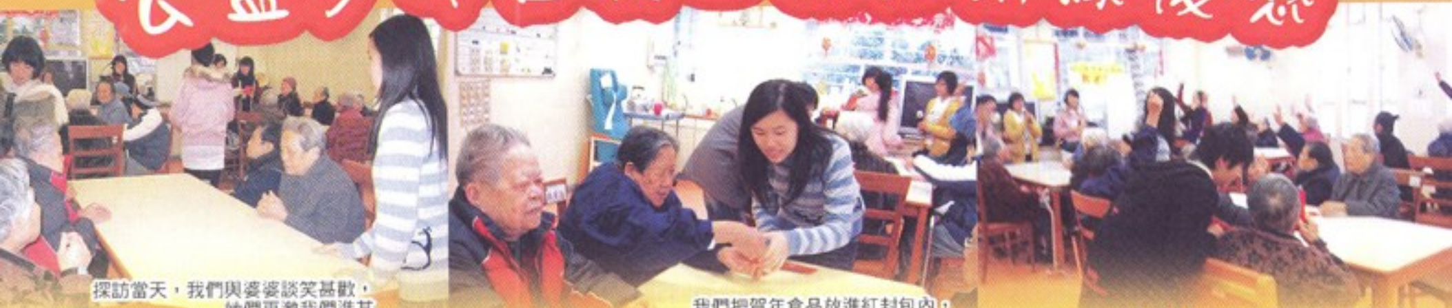
探訪當天，我們與婆婆談笑甚歡，她們更邀我們進其「閨房」呢！