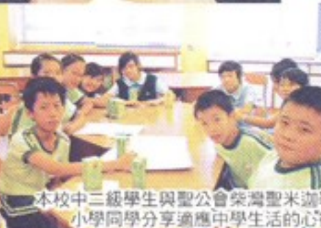
本校中三級學生與聖公會柴灣聖米迦勒小學同學分享適應中學生活的心得