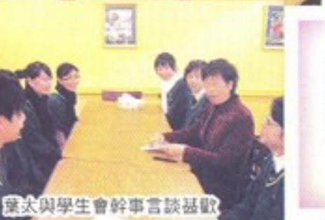
葉太與學生會幹事言談甚歡