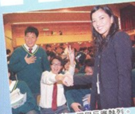
梁小姐親切友善，同學反應熱烈。