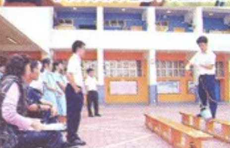
中六理科班同學向湖南省長沙市明德中學教師作實驗示範