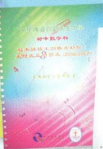
出版第二本資源冊