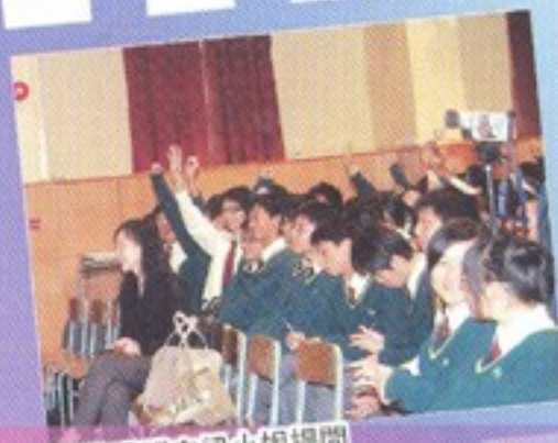
同學踴躍向梁小姐提問