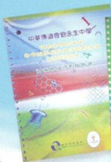
出版第一本資源冊