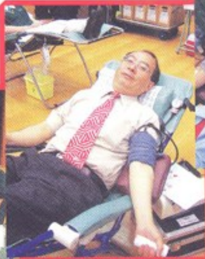
校長是我們眾人的好榜樣