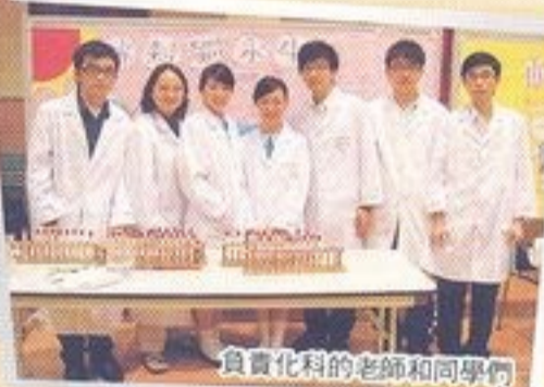
負責化科的老師和同學們

同學在活潑和互動的氣氛中領悟科學知識。最令人難忘的，是科學攤位和「雞蛋撞校園」。事實上，整個攤位的籌備工作很艱辛。我們出盡法寶，務求令同學體驗科學的奇妙。以下是籌備同學的分享：