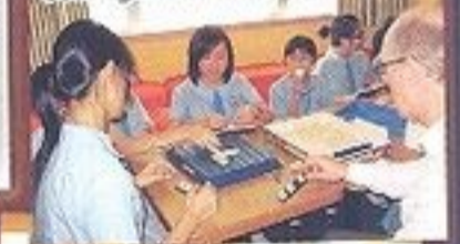
Students enjoyed playing board games in the café.

We will have different themes this year. This month's theme is 'Roctober' (Rock + October), which means you can sing karaoke with your teachers and classmates in the English Café. More events are coming up soon. Come and join us in the English Café!