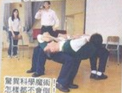
驚異科學魔術！怎樣都不會倒！