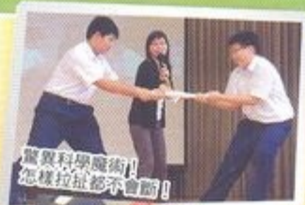
驚異科學魔術！怎樣拉扯都不會斷！

物理科攤位是「踩雞蛋」實驗。原來「零爆破」的實驗結果得來不易！我們嘗試不同的物料，結果發現厚的發泡膠板最有效減低每只雞蛋所受壓力。活動當天，同學們甫知道到能體驗踩雞蛋的樂趣，均踴躍欲試。當他們成功踏上雞蛋而不破後，都孜孜地聆聽負責同學講解其中的科學原理。