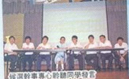
候選幹事專心聆聽同學發言

第四屆學生會已正式履新，希望同學積極參與學生會舉辦的活動，並不時與幹事溝通，表達意見，共同建構更快樂的校園。