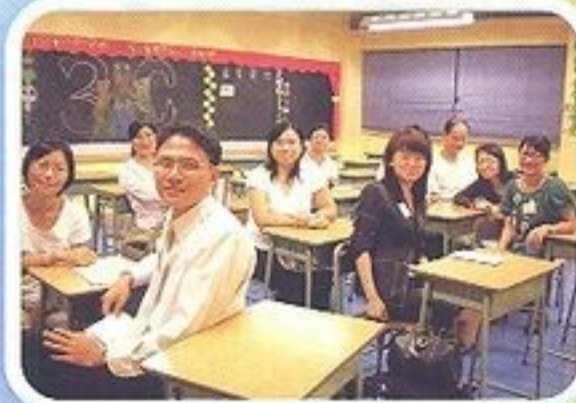
班主任與家長在課室交流

多位家長認同本校是一所優秀學校，其中一位家長更特地向校長致謝，因為他多次於晚上七時後到訪學校時，都得到校長親自接見。大家異口同聲讚揚校長不辭勞苦的工作態度及老師積極進取的教育精神，讓他們對學校的前景充滿信心。