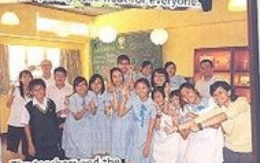
The teachers and the English Ambassadors were all ready!

ENGLISH CAFE ROCTOBER Coke Float = Rock + October