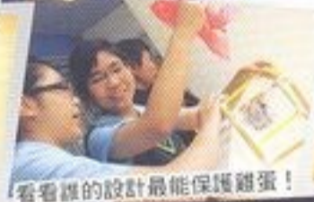
看看誰的設計最能保護雞蛋！