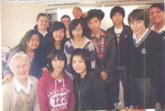
Our teacher and buddies