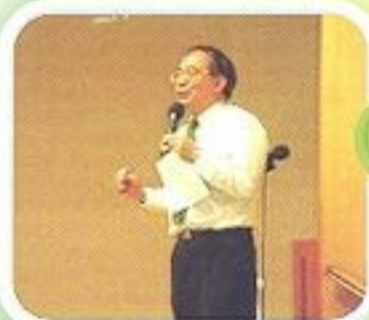
校長分享教養子女心得