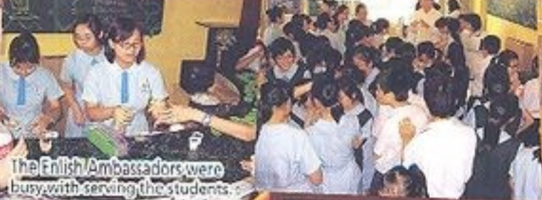
The English Ambassadors were busy with serving the students.