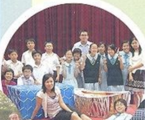
香港教育學院 棍球隊來訪