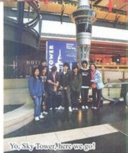
Yo, Sky Tower, here we go!

To make the summer holiday meaningful, our students joined the exchange tour held by the Careers Guidance Team of our school to New Zealand from 26th July to 11th August. They were exposed to an all-English environment in order to learn better English.