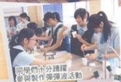
同學們十分踴躍參與製作彈彈波活動