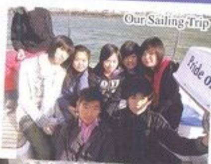
I can't stand for more than 30 seconds here!