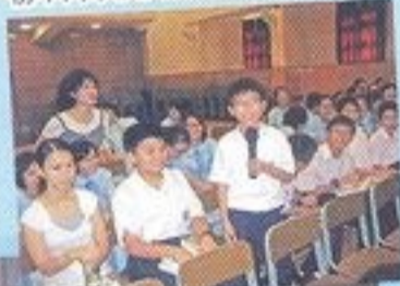
初中同學於問答時間發表意見

第三屆學生會週年大會及第四屆學生會幹事會選舉已順利於2008年9月26日圓滿結束。