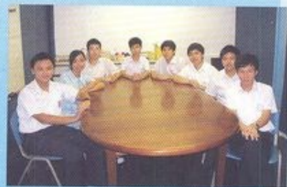
第三屆學生會幹事作07-08年度活動報告