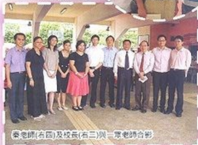
秦老師(右四)及校長(右三)與一眾老師合影