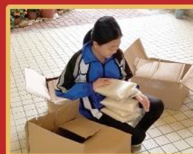
同學正將一包包米拆箱