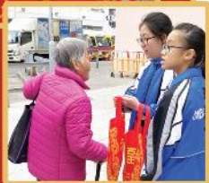
同學贈送福袋給區內長者