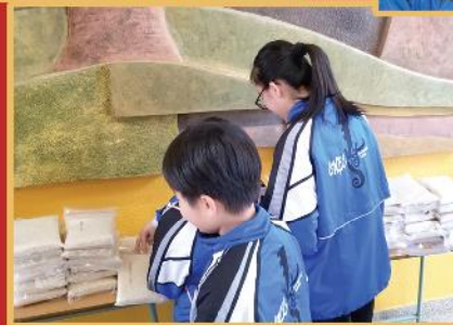
同學正將米入福袋