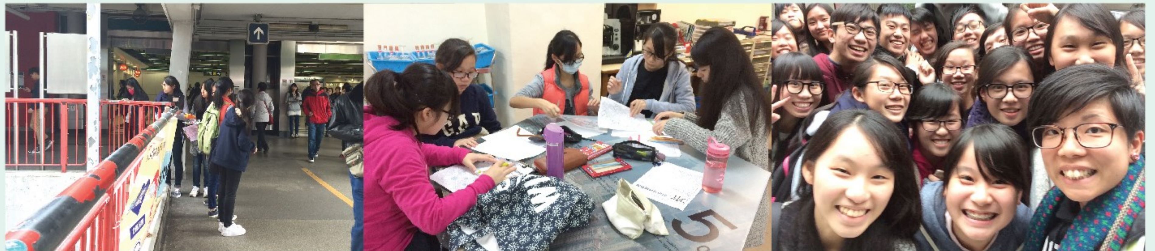
▲同學正在收集不同的環境數據