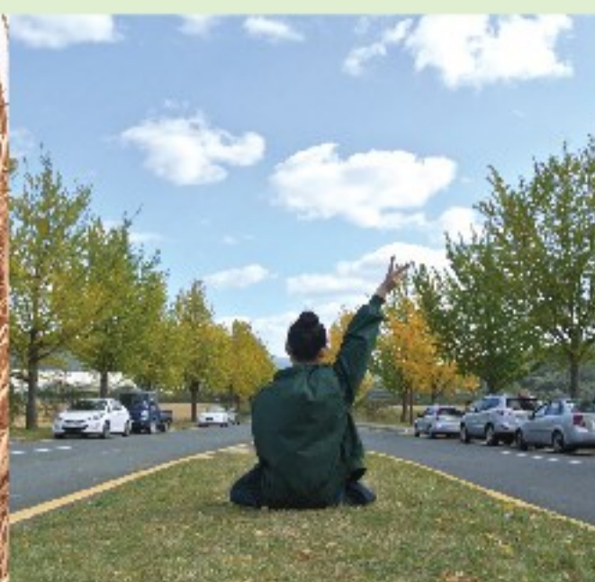
▲ 初秋的慶州統一殿門外佈滿了銀杏樹