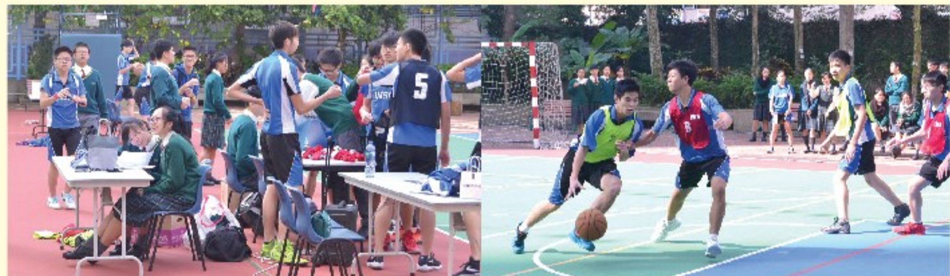
▲一眾課外活動幹事