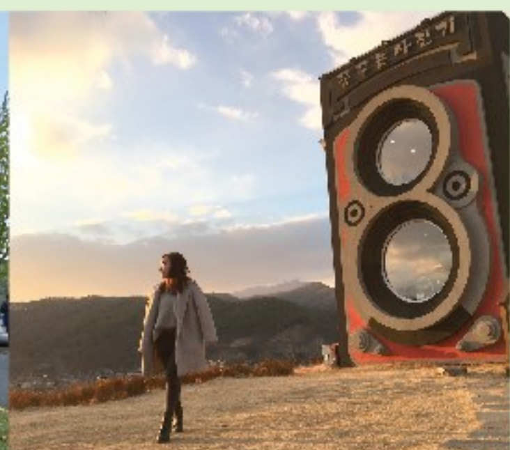
▲ 「作夢的照相機」位於京畿道楊平郡