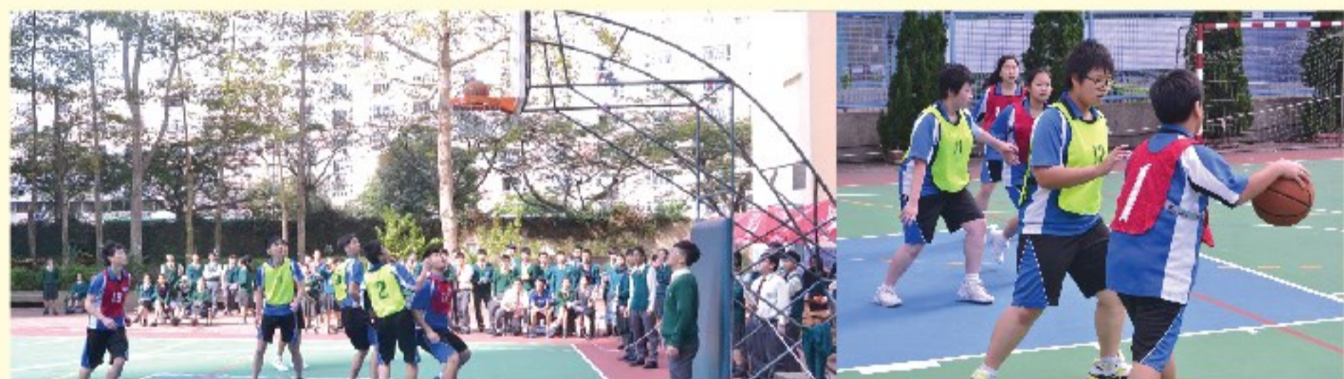
▲不少學生也到場支持運動員

在第一日的比賽當中，已經收到不同同學的質詢，負責老師只是作出輕微的調解，目的是想我們用自己的方法解決問題，此亦有利訓練我們日後工作的解難能力。我們不久將投身社會，面對的難題愈來愈多，不妨就趁在學校多訓練自己。初中的師弟妹並不要掉以輕心，你們將來也會擔當學校不同的領導職位，同時好好珍惜老師給予你們的機會，當老師信任你們的能力，就務必盡力完成，不可馬虎，辜負老師對你們的期望。